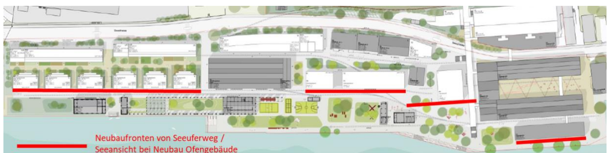
Abbildung 1: Seefront – wird das Ofengebäude durch einen Neubau ersetzt dominieren die Neubaufonten das Seeufer noch stärker und das ISOS Ortsbild wird weniger erfahrbar. Im Richtkonzept, welches der Bevölkerung vorgestellt wurde, ist das Gebäude weiterhin als zu erhaltender Bestand (grau) eingezeichnet.