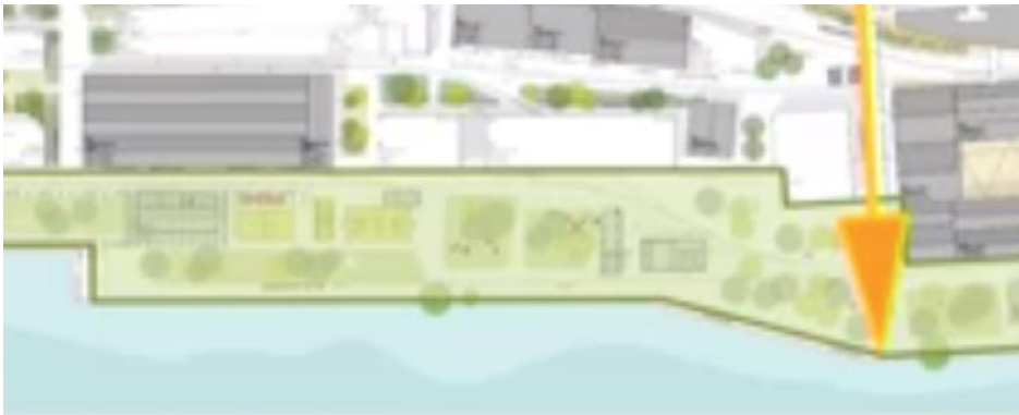
Abbildung 3. Screenshot der Vorstellung des Seeparks in der Bevölkerungsinformation von 22./23. Juni. Platz vor C2 (dimensioniert gemäss Richtkonzept) ist als integraler Teil des Seeparks präsentiert worden.

Die hohe geplante schulische Dichte soll nicht dazu führen, dass der Zugang zum Park durch eine als Schulnutzung empfundene „Pausenplatz“-Zone führt, sondern als zentraler ‚Ankunftsort‘ auf dem Gelände verstanden werden kann. Nur so kann sichergestellt werden, dass die Passerelle auch emotional direkt in den Park führt. Das wurde der Bevölkerung so präsentiert (Abbildung 3) und sollte entsprechend dem öffentlich gemachten Versprechen im Plan umgesetzt sein.